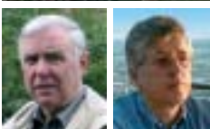
Tour-Ausarbeitung: Bernhard Enste, Gerd Flaig

Weitere touristische Informationen und Hinweise zu „Leben und Urlaub in Warstein“, Hotels, Pensionen und gemütlichen Kneipen finden Sie auf unseren Internetseiten: www.marketing-warstein.de und www.warstein.de